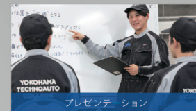
プレゼンテーション