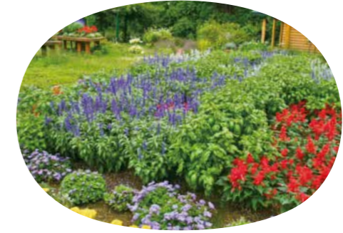
学内に ガーデンがあります